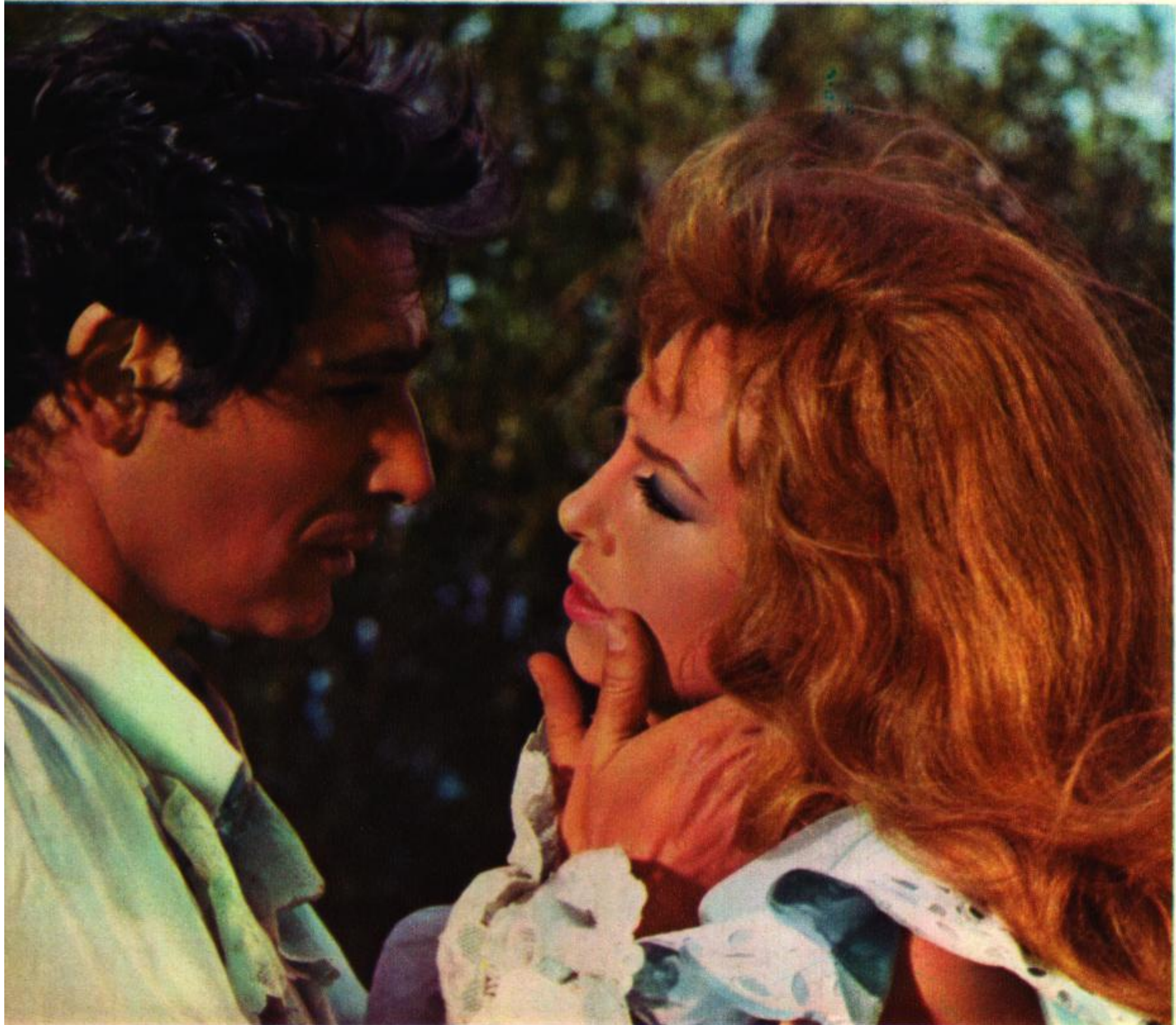
(2): Escrainville fait jeter Angélique dans une cale immonde avec de hommes monstrueux qui croupissent dans l'eau (3): Dans Indomptable Angélique Robert Hossein (Joffrey de Peyra est devenu le « Rescator » Capitaine d'un chébec