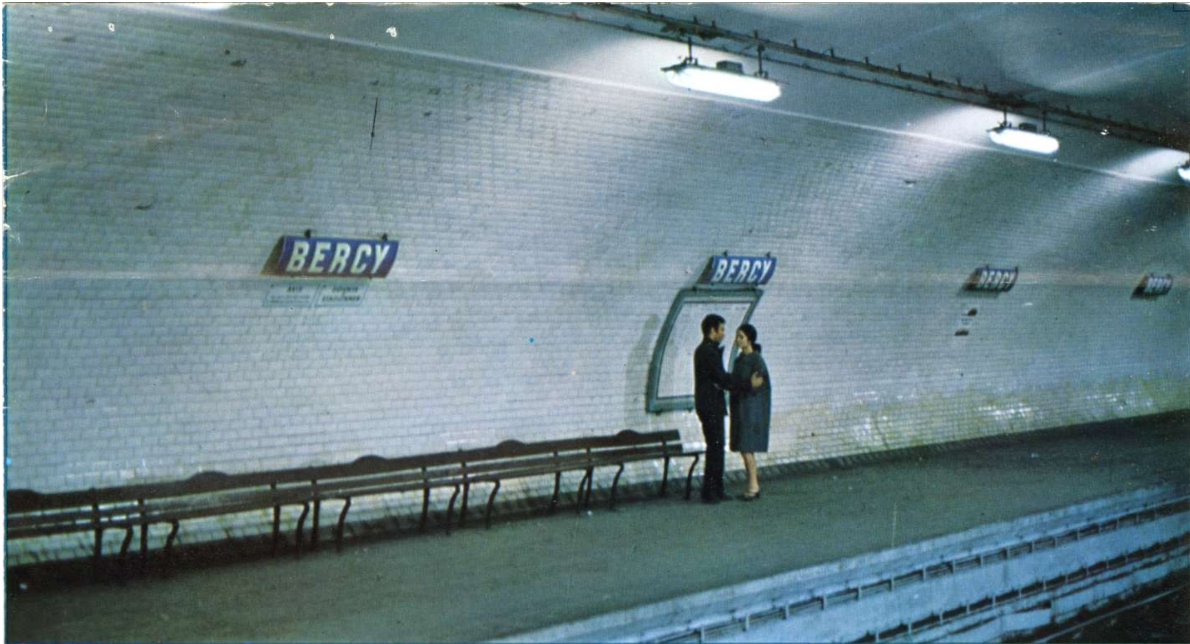
MOHAMED CHOUIKH - MARIE-JOSE NAT