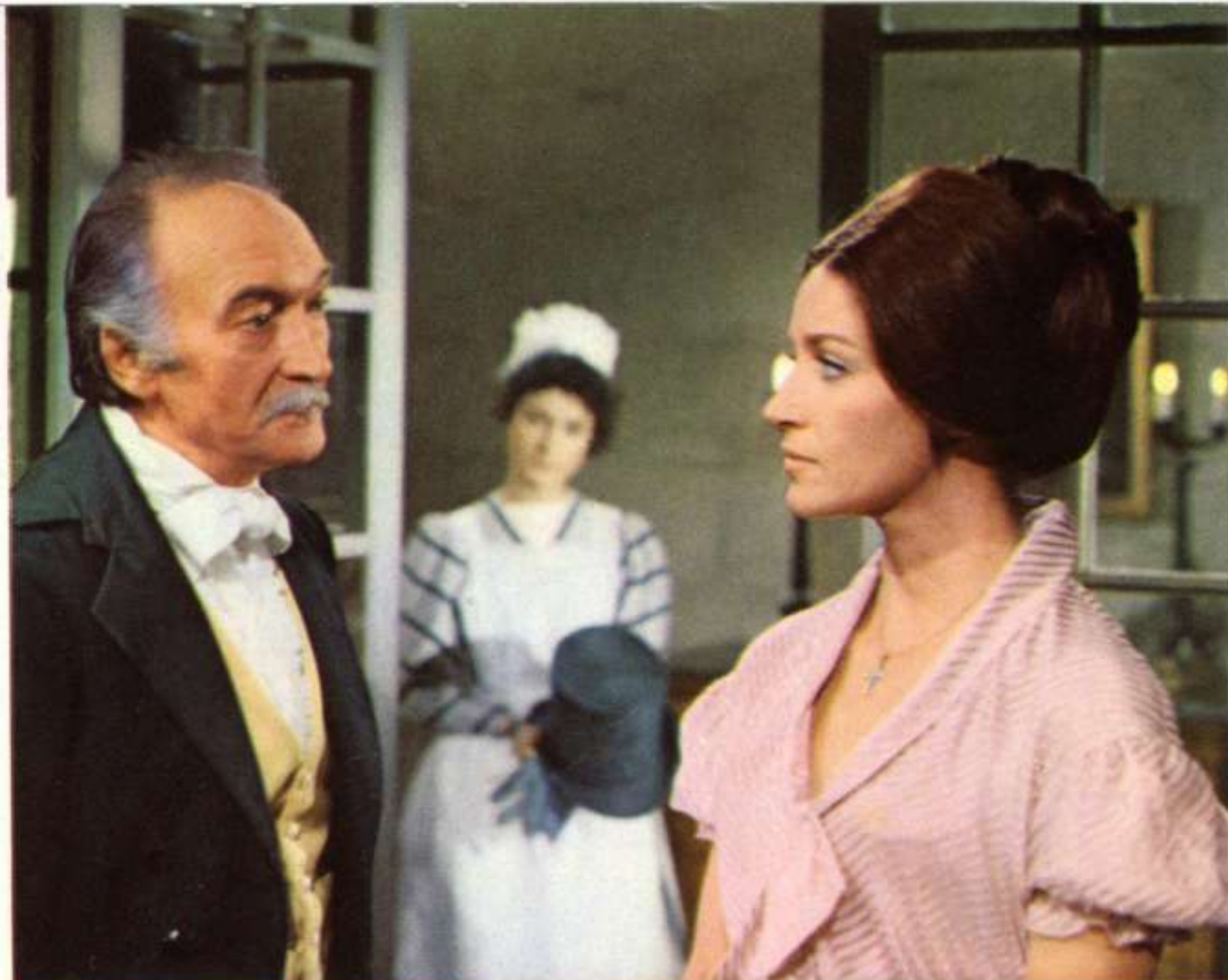
FRANCOISE FABIAN - JEAN VILAR