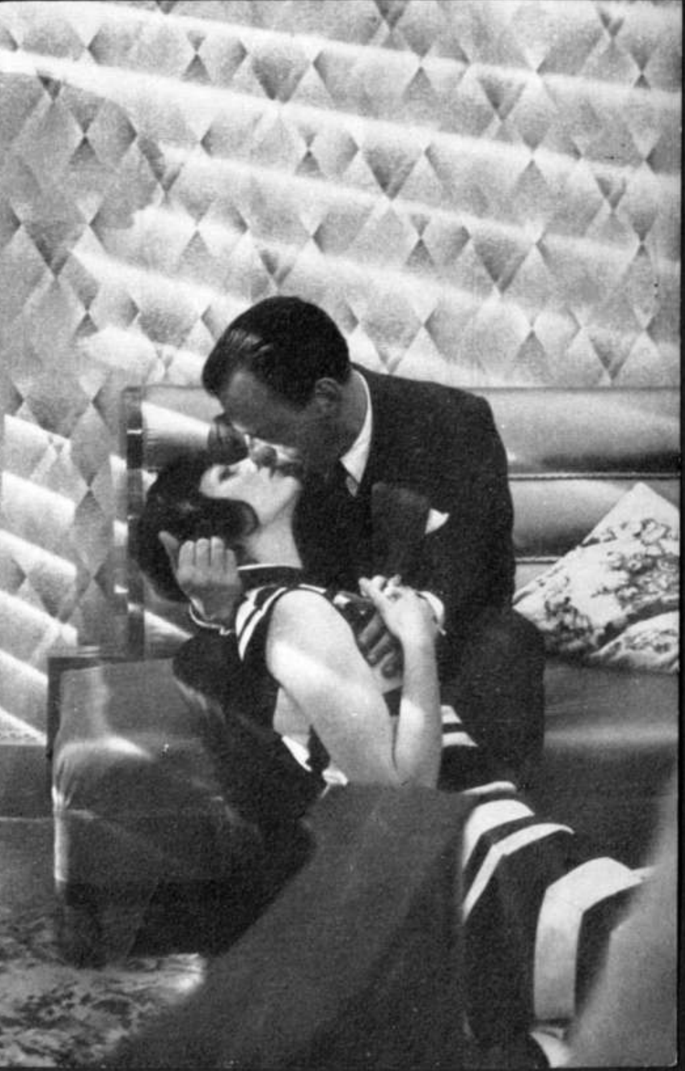
Jean-Louis Trintignant in Bernardo Bertolucci's new film about a pre-war Fascist assassin, from the novel by Alberto Moravia. Stefania Sandrelli (right, and far right) plays his wife.