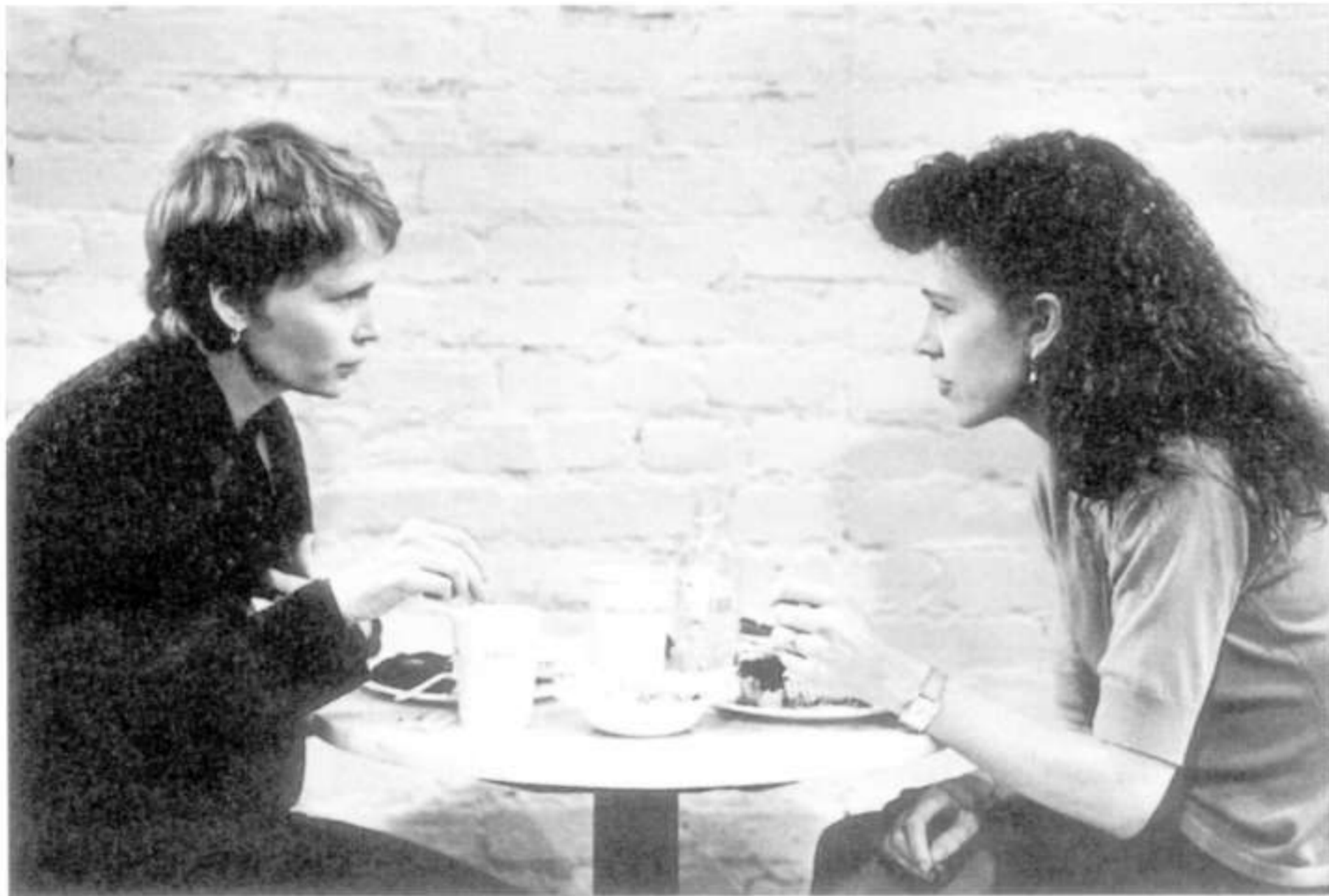
Mia Farrow, Judy Davis