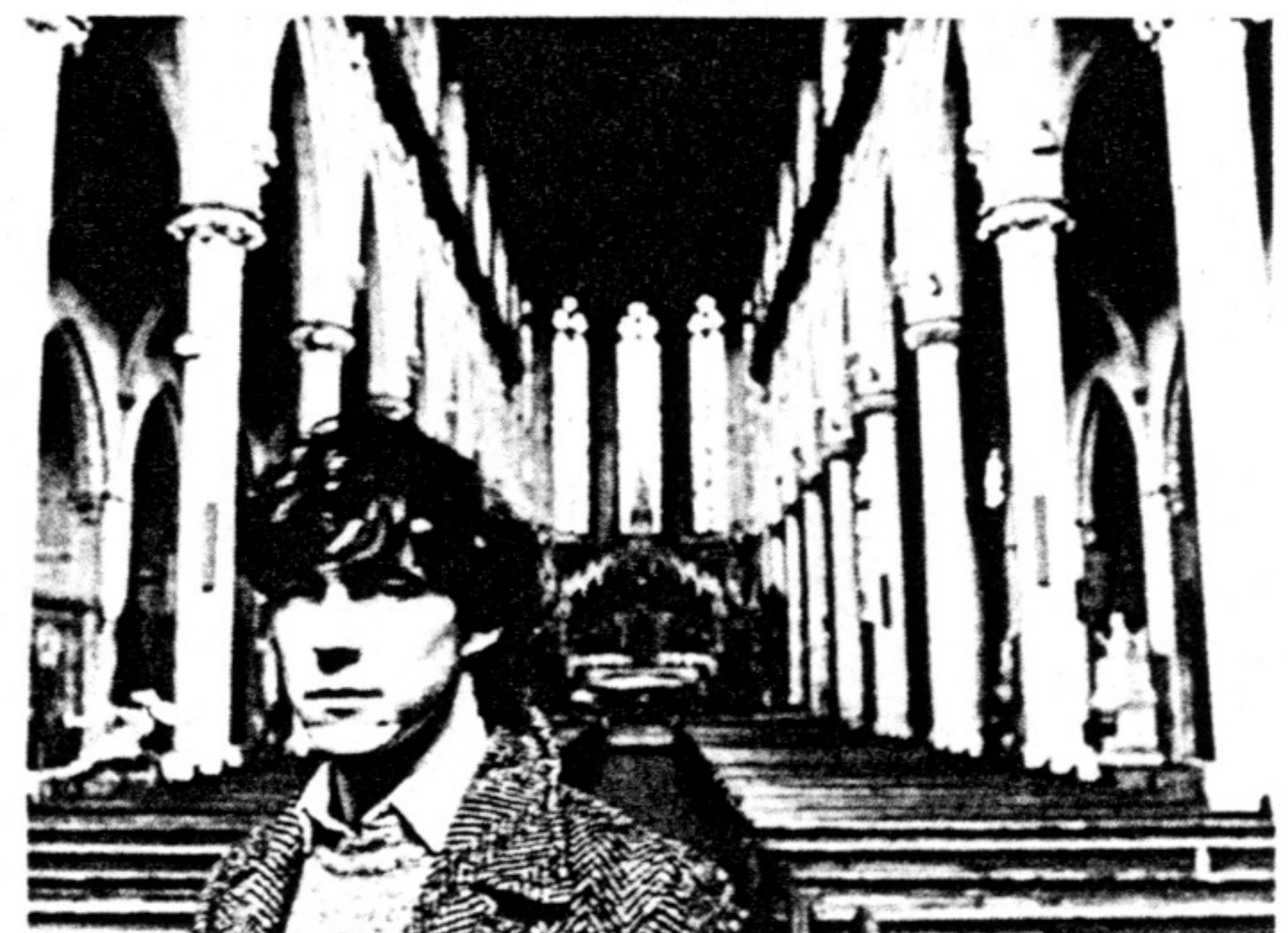
CHARLES STURRIDGE