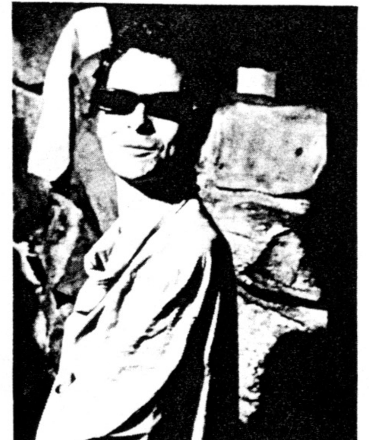
JULIEN TEMPLE