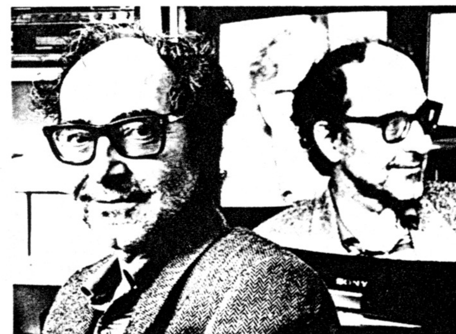
JEAN LUC GODARD