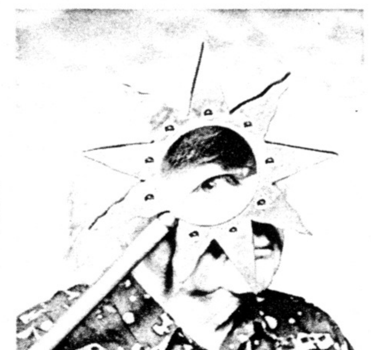
KEN RUSSELL