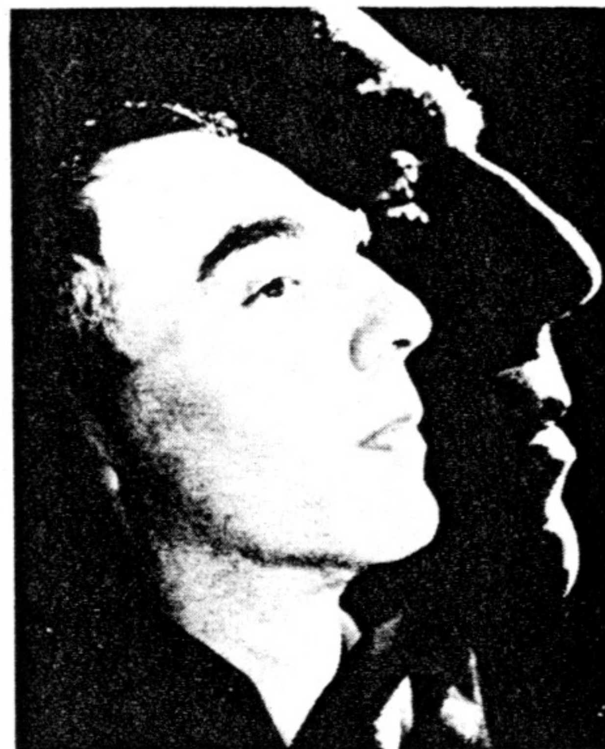
DEREK JARMAN BY ANGUS McBEAN