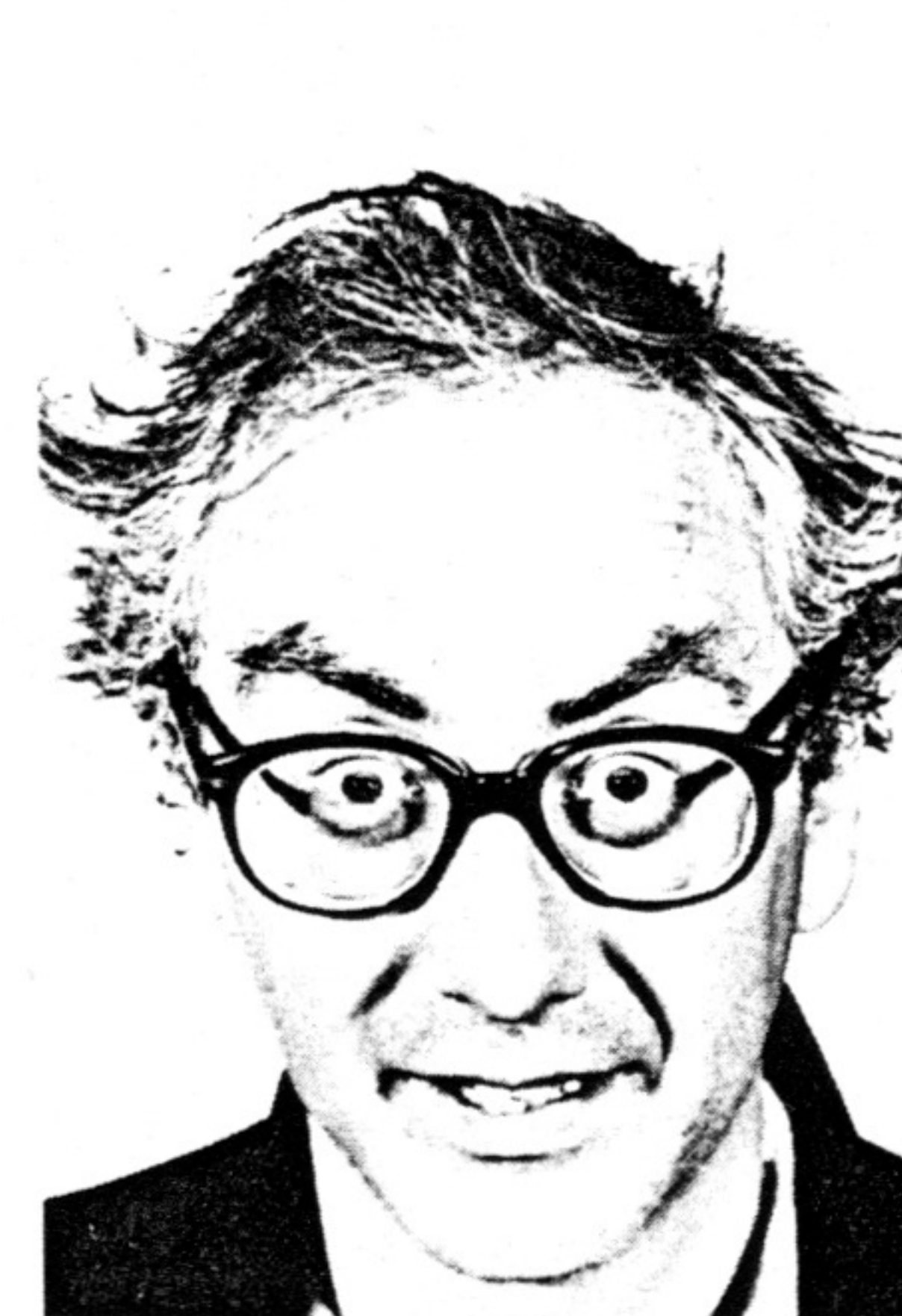
DON BOYD