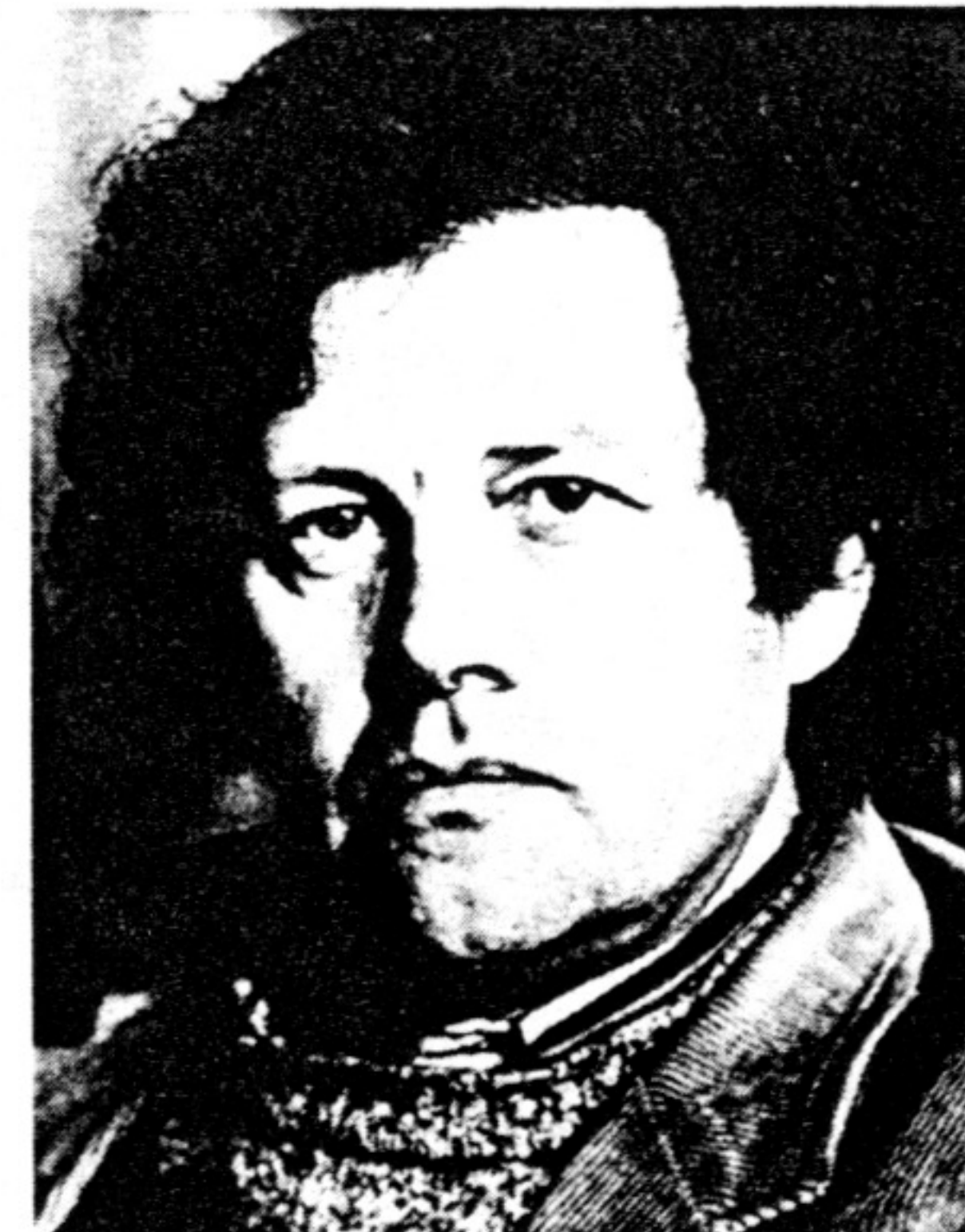
BRUCE BERESFORD