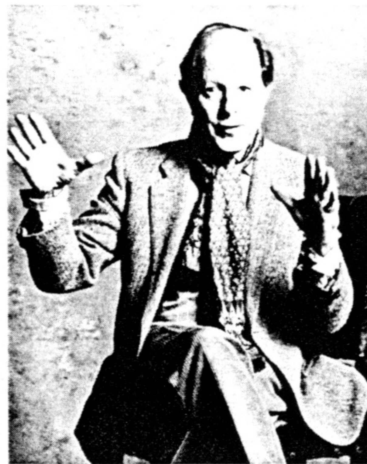
NICOLAS ROEG